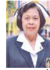
อุปนายกคนที่ ๒ ดร.ยุวดี เกตสัมพันธ์