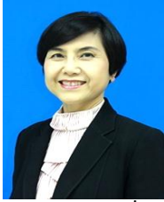
อุปนายกคนที่ ๑ ผศ. ดร.พิกุล นันทชัยพันธ์